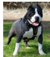
American Pitbull Terrier