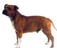
Staff. Bull Terrier