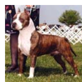
Staff. Terrier Americano